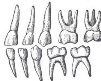
Zuby dočasného chrupu