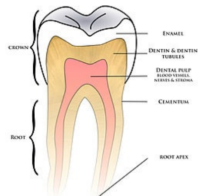
Anatomický popis zubu