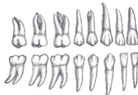
Zuby stálého chrupu