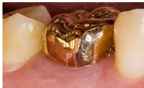
Celoplášťová zlatá korunka.