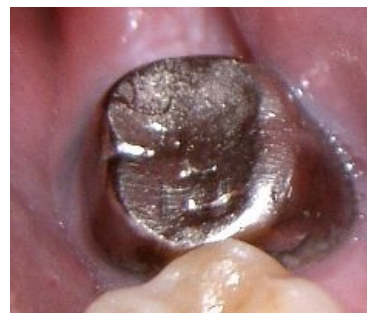
Celoplášťová kovová korunka.