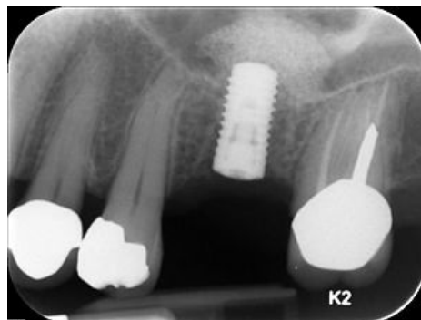
Dentální implantát (RTG)