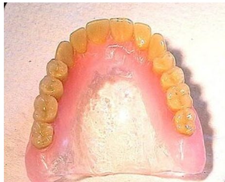
Mukózní přenos u celkové zubní náhrady

Částečná snímatelné zubní náhrady dělíme podle základního dělení na deskové a skeletové. Skeletové se vyznačují dentomukózním přenosem tlaku a deskové přenášejí tlak mukózně.