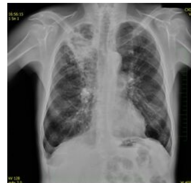
V horním poli plicním vpravo cystoidní projasnění s naznačenou hladinkou, zánětlivé změny s kavitacemi, v.s. TBC pneumonie