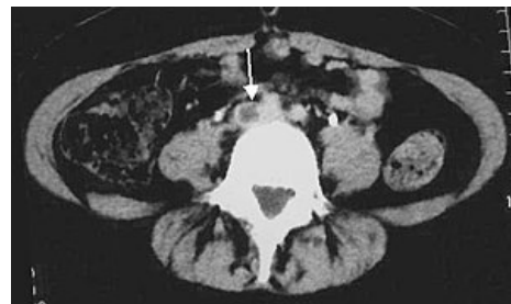
Trombóza společné pánevní tepny (CT)