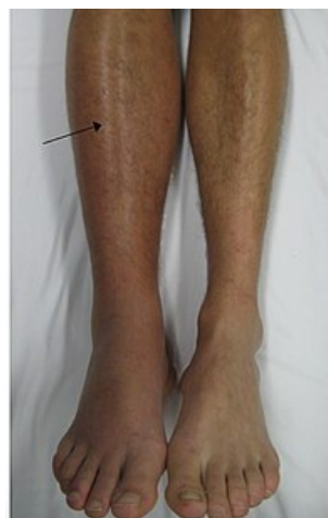
Hluboká žilní trombóza