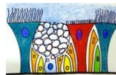
Epitel dýchacích cest

Vrstva velmi buněčného řidkého kolagenního vaziva obsahuje cévy , nemyelinizované nervy a seromucinózní žlázy . Přítomny jsou též více či méně četné plazmatické buňky a lymfocyty , které dokonce mohou tvořit folikuly (BALT).