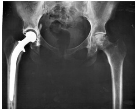
rentgenový snímek - totální endoprotéza kyčelního kloubu

Základní dělení implantátů je na náhradu cementovanou a náhradu necementovanou , podle toho, jestli se k jejich upevnění používá kostní cement (polymetylmetakrylátu). Tzv. hybridní náhrada kombinuje předchozí dva typy, přičemž pomocí kostního cementu je upevněna pouze hlavice femuru.