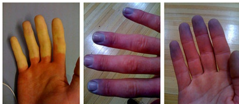
Barevné změny prstů ruky

www.nutraceutica.sk/sk/nutraceutika_pri_ochoreniach/raynaudov_syndrom.aspx