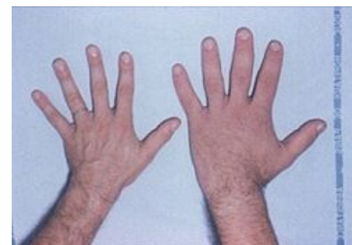
Ruka pacienta s akromegalií