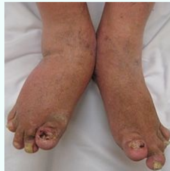
Klinický obraz těžké psoriatické artritidy