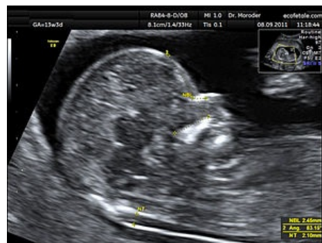
USG plodu se zvýrazněnou nuchální translucencí.