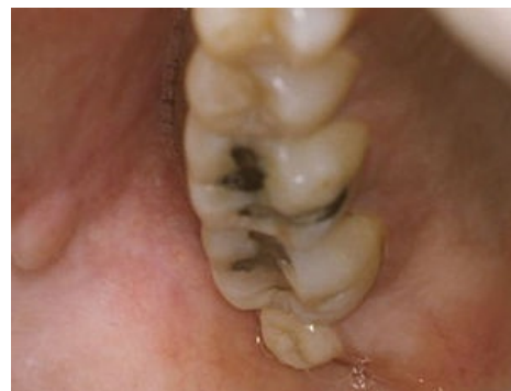
Mikrodonický zub 18

Hypoplastické změny na zubech jsou způsobeny přerušením nebo předčasným zastavením amelogeneze. Poškození může nastat při horečnatých stavech, průjemových onemocněních, metabolických poruchách... Hypoplastické zuby se vyznačují různorodým vzhledem, jamkami, rýhami. Sklovina je tenká, nerovnoměrná, drsná.