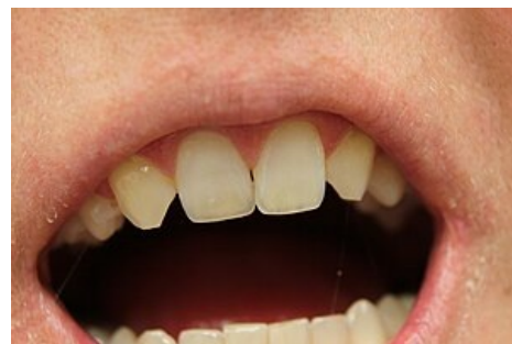
Hypodoncie; chybějící druhé horní řezáky