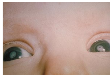
Vrozená katarakta při syndromu kongenitálních zarděnek

Vrozená katarakta může být oboustranná, nebo jednostranná, a její příčiny jsou různorodé. Uplatňují se zde virové, parazitární nebo jiné zánětlivé infekce v prenatálním období. Dále mohou působit genetické predispozice (familiární). Celá řada případů ovšem zůstává neobjasněna (idiopatická). Mezi projevy katarakty patří: šedavý lesk v zornici, šilhání, nystagmus nebo bloudivé pohyby očí.