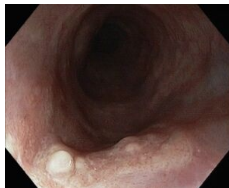
Spinocelulární karcinom jícnu, pohled endoskopem.