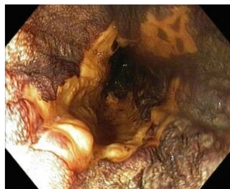
Spinocelulární karcinom jícnu (tentýž pacient), pohled endoskopem po použití Lugolova roztoku, který lépe ozřejmí rozsah léze.