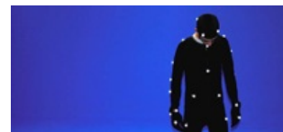
Referenční body na těle

1. Motion Capture | Optické snímací systémy – Patří mezi přesnější a flexibilnější snímače. Optické snímací systémy používají ke zjištění polohy a umístění objektu kamerový systém. V současné době většina komerčně dostupných systémů používá pro určování polohy CCD („Charge-Coupled Device“) kamery.