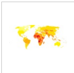
Výskyt meningitid (WHO 2004)

Meningitida je akutně nebo chronicky probíhající zánětlivé onemocnění měkkých plen mozkových, leptomeninges ( arachnoidea a pia mater ).