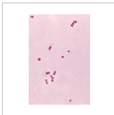
Neisseria meningitidis – mikroskopie