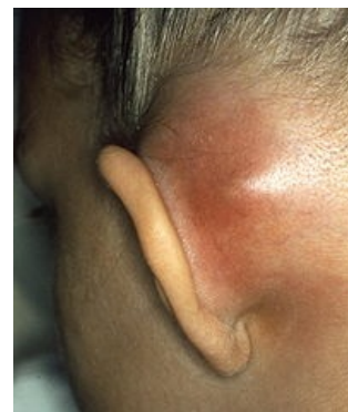
Subperiostální absces jako komplikace mastoiditidy