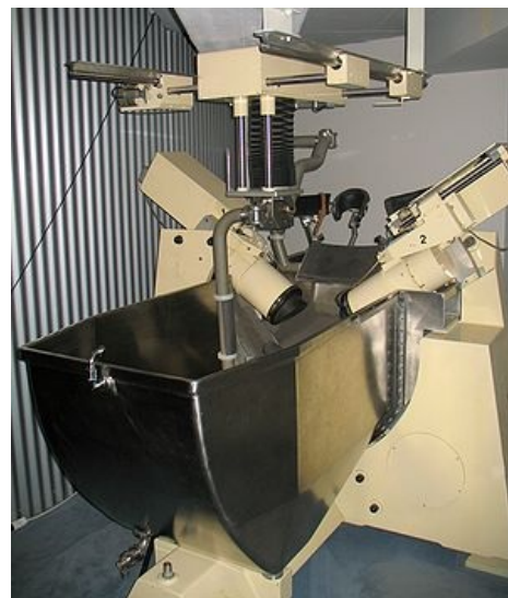
Historicky první komerčně dostupný litotryptor Dornier HM1