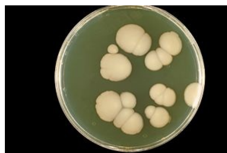
Candida albicans na SabHI agaru.