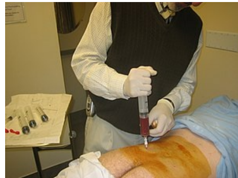
Odběr kostní dřeně

Majoritně jsou za uvedené děje odpovědné různé skupiny cytokinů , které působí jako kolony stimulující faktory ( colony-stimulating factors , CSF). Obrovskou a nezastupitelnou roli v řízení krvetvorby mají dva hormony – erythropoetin a trombopoetin . Oba jsou produkovány ledvinami (erythropoetin) a játry (trombopoetin).