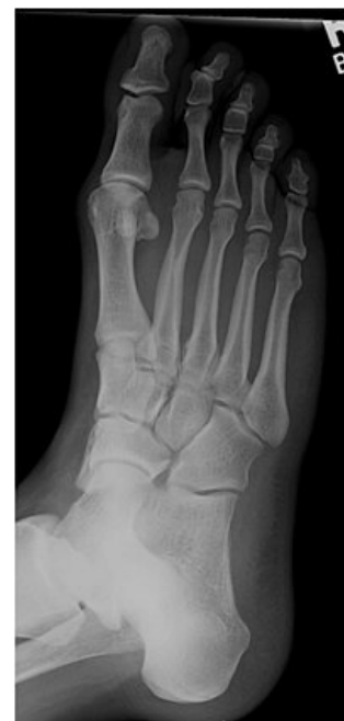
Planta rtg snímek