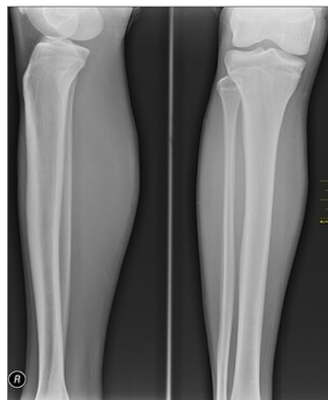
Rentgenový snímek kostí dolní končetiny