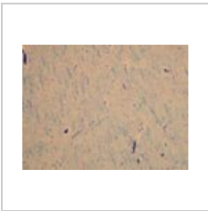
Mozek3.jpg 1,037 × 778; 224 KB