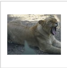
Lev.jpg 3,648 × 2,736; 4.52 MB