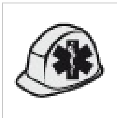
Pracovní lékařstv... 50 × 50; 5 KB