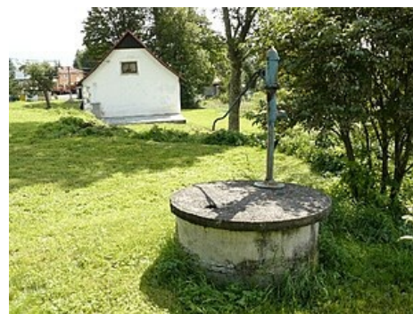
Studna – betonová skruž