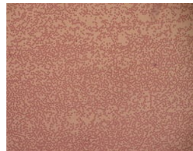
Fotografie vzorku krve vykazující významnou neutropenii