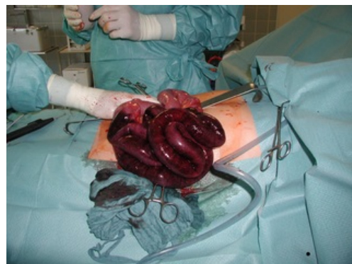
Chirurgická léčba ileu