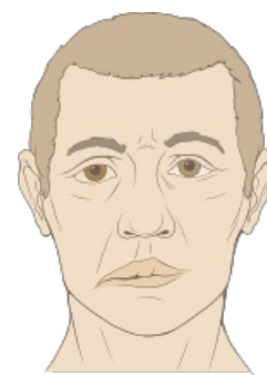
Bellova obrna: pokleslý koutek, vyhlazená nasolabiální rýha, neschopnost sraštit čelo