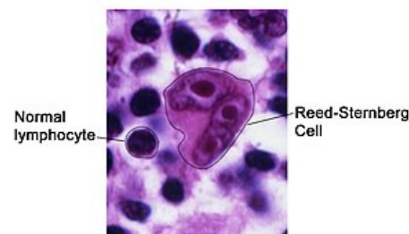
Mikroskopický obraz: buňka Reedové a Sternberga - "owl eyes"

Medscape 201886 ( https://emedicine.medscape.com/article/201886-overview )