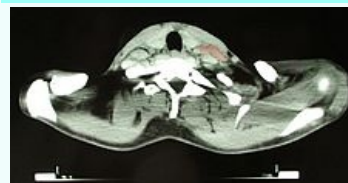
CT obraz pacientky trpící Hodgkinovým lymfomem