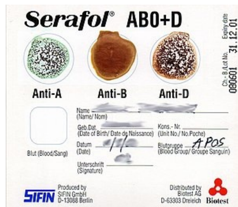
Zkouška u lůžka