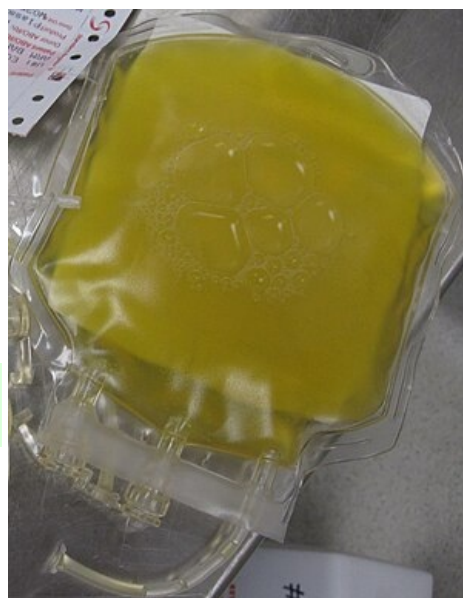
Čerstvě zmražená plazma