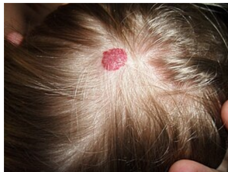
Hemangiom na vlasaté části hlavy

Hemangiomy se mohou vyvinout kdykoli během prvních měsíců života. Jsou přítomné u 10 % dětí v jednom roce věku. Dětské hemangiomy mají tendenci k vymizení – 50 % zanikne do 5 let věku, 90 % do 10 let věku. V místě hemangiomu může následně vzniknout atrofie, teleangiektázie, hypopigmentace či jizva. Mnohočetné kožní hemangiomy mohou být doprovázené hemangiomy jater a trávicího traktu s rizikem obstrukce či krvácení. Vzácně vedou rozsáhlé a mnohočetné hemangiomy k srdečnímu selhání na podkladě velkého srdečního výdeje. [1]