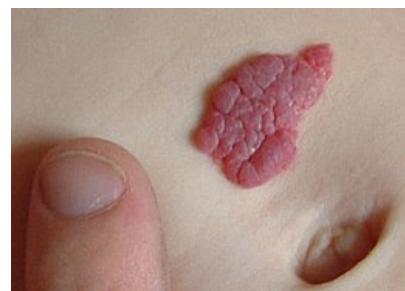
Jahodové znaménko - juvenilní hemangiom.

U dětí se vyskytuje ve formě tzv. "jahodového znaménka", juvenilní hemangiom , vyvýšený jemně hrbolatý útvar. V dutině ústní se zase můžeme setkat s posttraumatickým útvarem - lobulární kapilárním hemangiomem, neboli pyogenním granulomem.