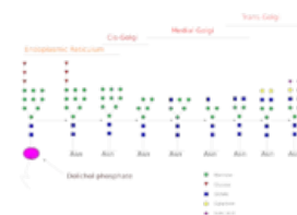
Glykosylace v ER a GA