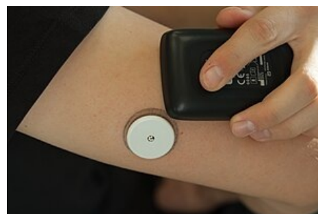
Kontinuální měření koncentrace glukózy