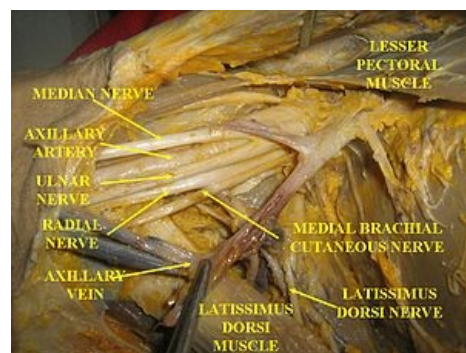
Vypitvaná fossa axillaris