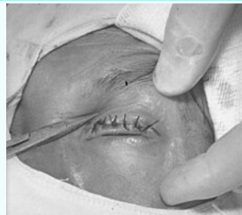
Entropium a trichiazie způsobené trachomem.

Klinický obraz postavení okrajů očního víčka, při které okraj víčka s řasami směřuje proti povrchu bulbu