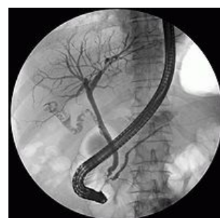
ERCP – rentgenový snímek