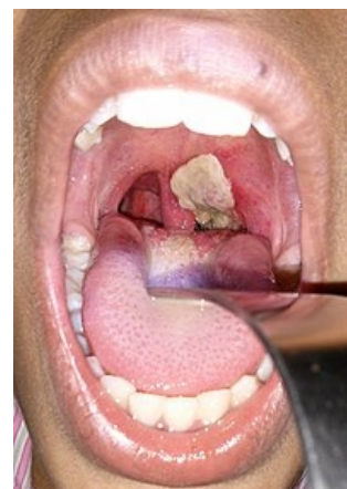
Pablána u difterie