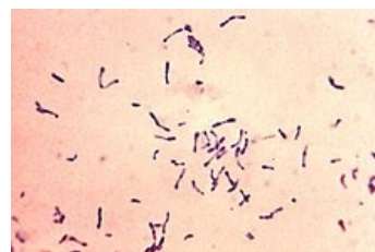
Corynebacterium diphtheriae barvené metylénovou modří