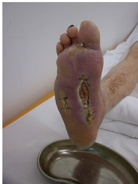
Syndrom diabetické nohy