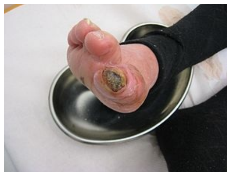
Syndrom diabetické nohy