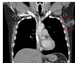
CT, dermatofibrosarcoma protuberans v levé axile