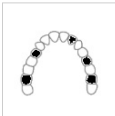
Třída III – více mezer