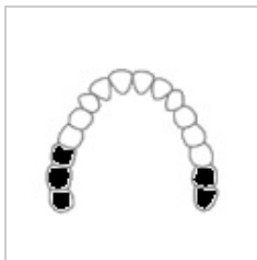
Třída II – oboustranně bez mezer