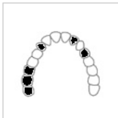
Třída II – jednostranně s mezerami