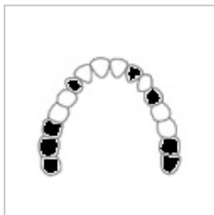
Třída II – oboustranně s mezerami