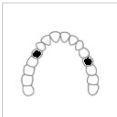
Třída III – dvě mezer