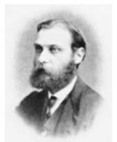
Walther Flemming (1843–1905)