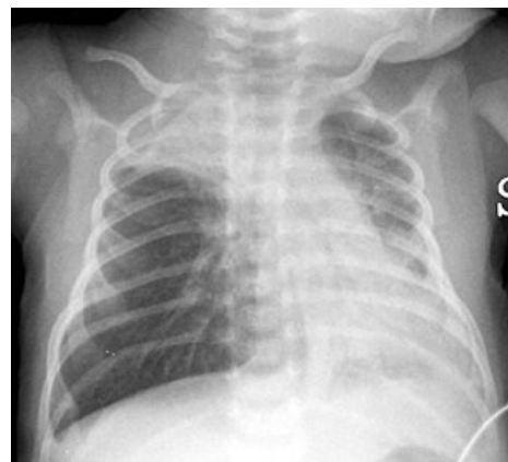
Hrudní RTG 16denního dítěte - výrazná hyperinflace plic s oploštěním bránice, bilaterální atelektázy v pravém plicním hrotu a v levé bazální oblasti.