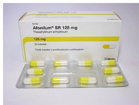
Theofylin k perorálnímu použití