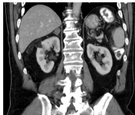
Angiomyolipom pravé ledviny – CT - hypodenzní ložisko /tuk/