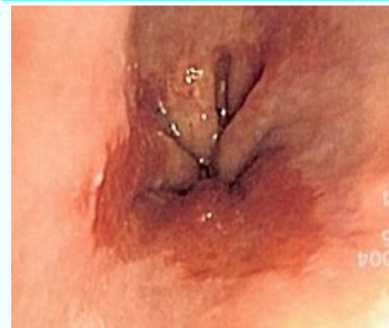
Barrettův jícen při endoskopii