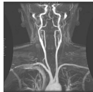
Angiografie magnetickou rezonancí