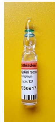
Bisulepin 0,5mg/ml v ampuli k i.v. podání